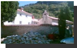
MANASTIR DULJEVO-CRNA GORA