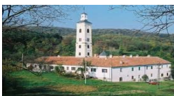
MANASTIR VELIKA REMETA