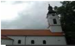
DONJA CRKVA SREMSKI KARLOVCI