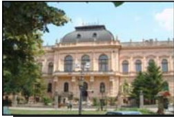
STARI PATRIJARŠKI DVOR - SREMSKI KARLOVCI